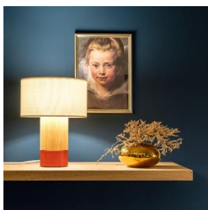
Klippa (ab € 413,-)