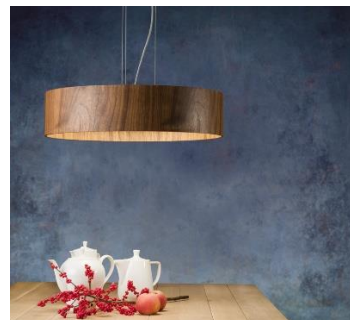
Lara wood (ab € 600,-)