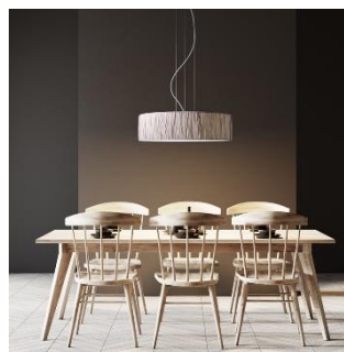
Sten crash (ab € 553,-)