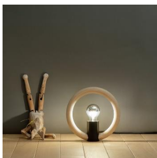
Rink (ab € 170,-)