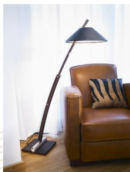
Bow (ab € 766,-)