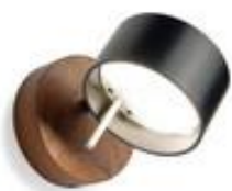
Frits pur (ab € 392,-)