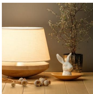
Kjell (ab € 493,-)