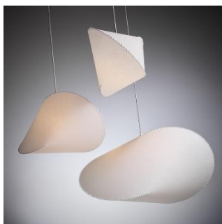
Floyd (ab € 398,-)